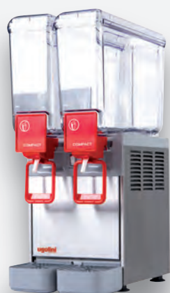
Mod. COMPACT 8/2