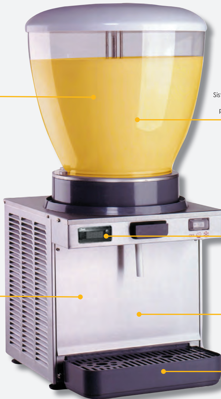
Mod. NJ 19

Recogegotas con boya indicativa de llenado.