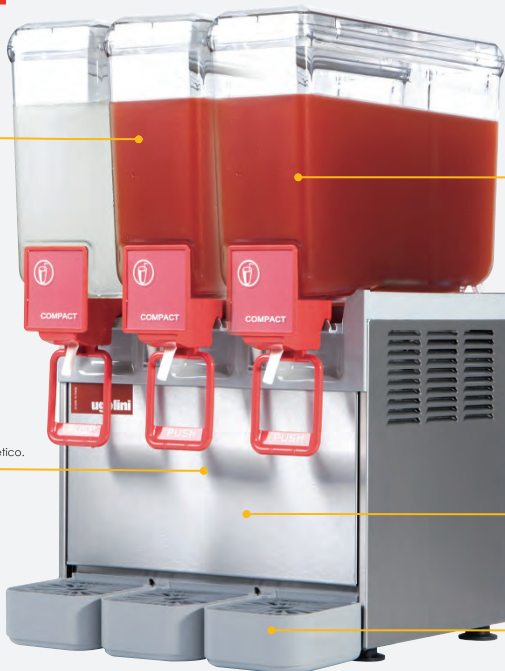
Mod. COMPACT 8/3

Recogegotas con boya indicativa de llenado.