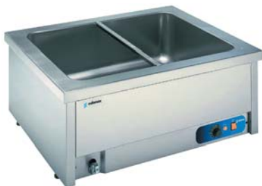
BMSM-211 Baño María sobremesa con agua.