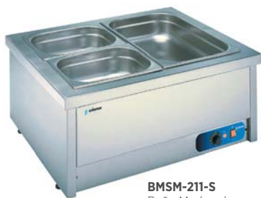
BMSM-211-S Baño María sobremesa sin agua.