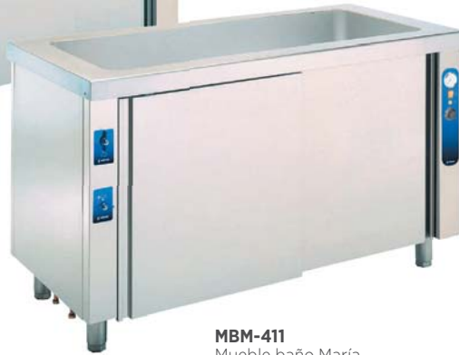
MBM-411 Mueble baño María con reserva inferior neutra