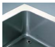
Cuba embutida y esquinas redondeadas