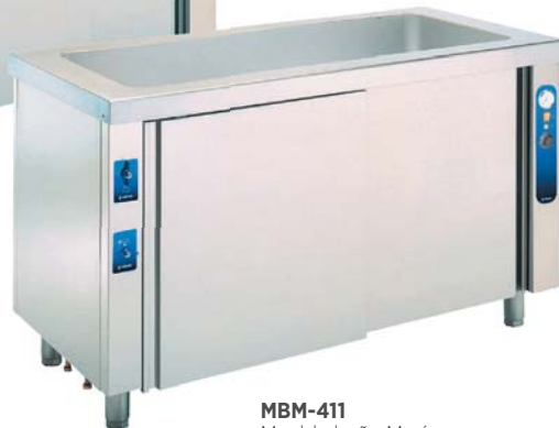
MBM-411 Mueble baño María con reserva inferior neutra