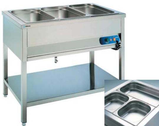
BMSR-311 (cubetas no incluidas)