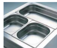
Alojan cubetas GN 1/1 o subdivisiones.