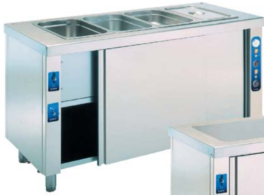
MBMR-411 Mueble baño María con reserva inferior caliente