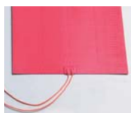
Calefacción de la cuba con resistencias de silicona (Modelos BMSM).