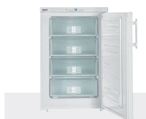
GP 1376 4 CAJONES / EF. ENERG. A++ -14°C/-28°C