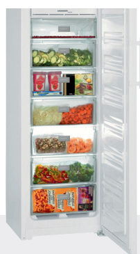
GNP 2713 7 CAJONES EFICIENCIA ENERGÉTICA A++ -15°C/-25°C