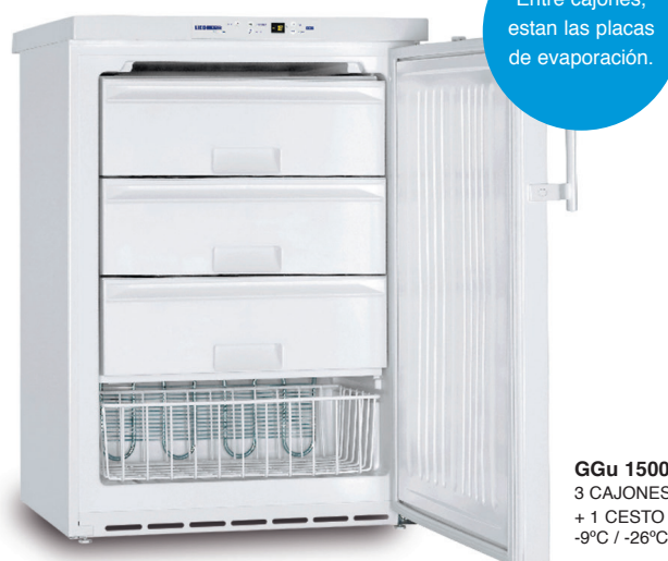
GGu 1500 3 CAJONES + 1 CESTO -9°C / -26°C