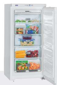
GNP 1913 5 CAJONES EFICIENCIA ENERGÉTICA A++ -15°C/-25°C