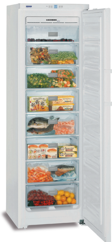
GNP 3013 8 CAJONES EFICIENCIA ENERGÉTICA A++ -15°C/-25°C