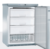
GGu 1550 INOX 3 CAJONES + 1 CESTA -9°C/-26°C

Display de temperatura segmentada en los modelos GGUesf 1405 y GGUesf 1405