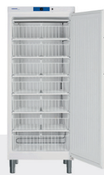
GG 5210 - Estático 14 CESTOS / CAJONES -14°C/-28°C