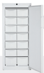
G 5216 - Estático 14 CAJONES -14°C/-28°C