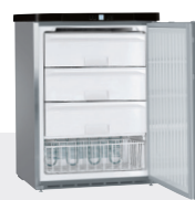
GGUesf 1405 3 CAJONES + 1 CESTA -15°C/-32°C