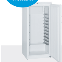
BG 5040 CONGELADOR ESTÁTICO -9°C/-26°C