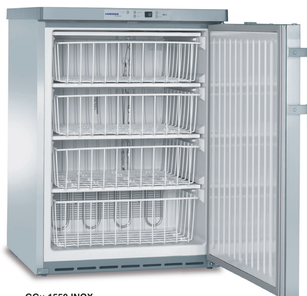
GGu 1550 INOX 4 CESTOS -9°C/-26°C