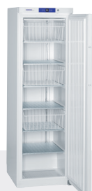
GG 4010 - Estático 3 CESTOS + 4 ESTANTES -14°C/-28°C