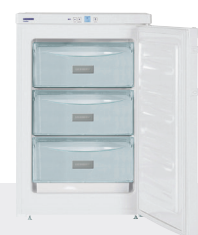
G 1223 3 CAJONES / EF. ENERG. A+ -14°C/-28°C