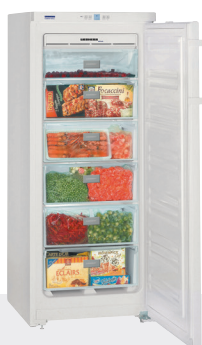
GNP 2313 6 CAJONES EFICIENCIA ENERGÉTICA A++ -15°C/-25°C