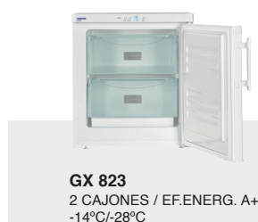
GX 823 2 CAJONES / EF.ENERG. A+ -14°C/-28°C