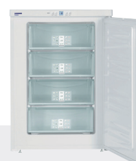
GP 1486 4 CAJONES / EF. ENERG. A+++ -14°C/-28°C