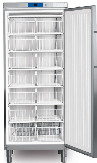
GG 5260 INOX - Estático 14 CESTOS / CAJONES -14°C/-28°C