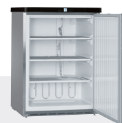
GGUesf 1405 SIN CAJONES NI CESTAS -15°C/-32°C