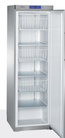
GG 4060 INOX - Estático 3 CESTOS + 4 ESTANTES -14°C/-28°C