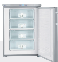
GPesf 1476 puerta INOX 4 CAJONES / EF. ENERG= A++ -14°C/-28°C