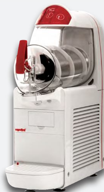
Mod. NG 6/1 EASY