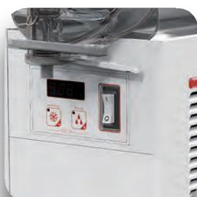
Control electrónicos MICRO.