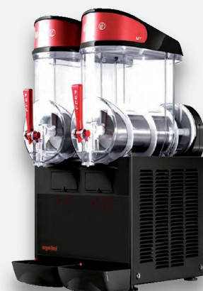
Mod. MT 2B NEGRA