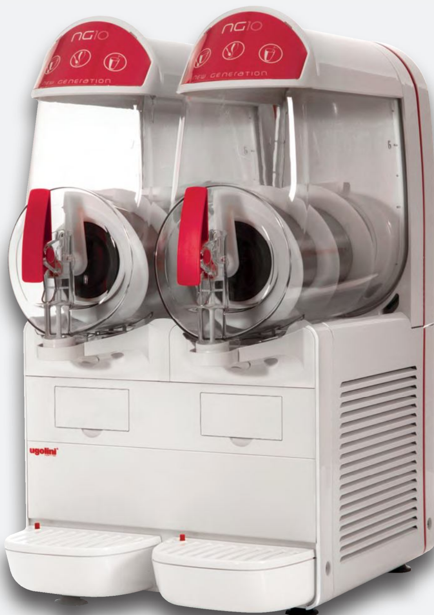
Mod. NG 10/2 EASY