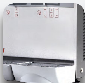
Recoge gotas extraíble.