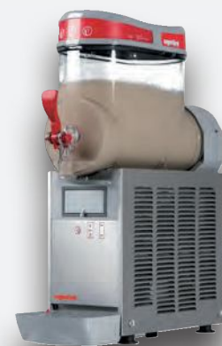
Mod. MT MINI 1