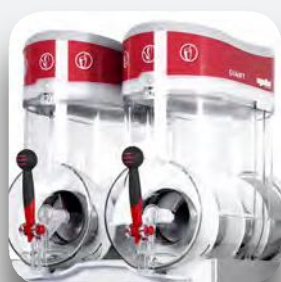
Depósitos de 15 litros.