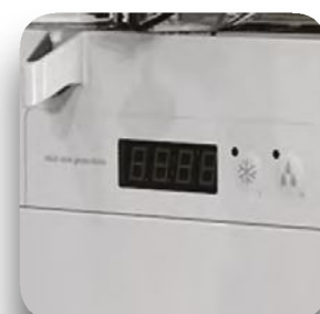
Control electrónicos ICON.