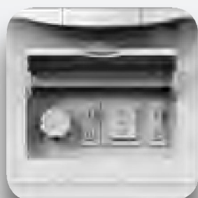
Panel mandos electromecánicos.