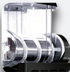
Sistema de conducción magnética.