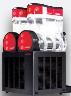
Mod. GIANT NEGRA