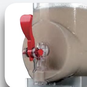
Maneta salida producto.