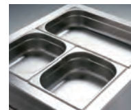
Alojan cubetas GN 1/1 o subdivisiones.