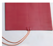
Calefacción de la cuba con resistencias de silicona (Modelos BMSM).