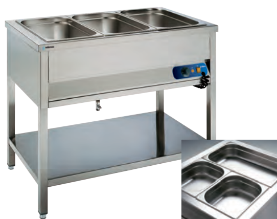
BMSR-311 (cubetas no incluidas)