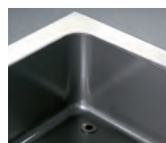
Cuba embutida y esquinas redondeadas