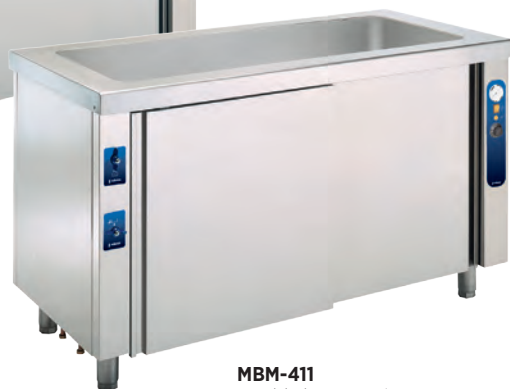
MBM-411 Mueble baño María con reserva inferior neutra