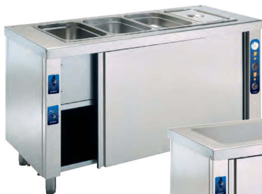
MBMR-411 Mueble baño María con reserva inferior caliente