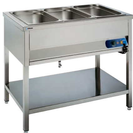
BMSR-311 (cubetas no incluidas)