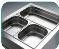
Profundidad máxima de cubetas 200 mm.