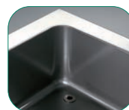
Cuba embutida y esquinas Redondeadas