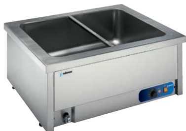
BMSM-211 Baño María sobremesa con agua.