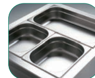
Alojan cubetas GN 1 / 1 o subdivisiones.