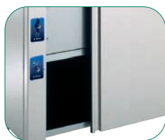
Mueble baño María con reserva inferior caliente.