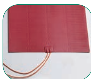
Calefacción de la cuba con resistencias de silicona (Modelos BMSM).