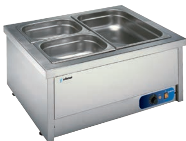
BMSM-211-S Baño María sobremesa sin agua.