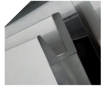
Cajón con tirador incorporado.