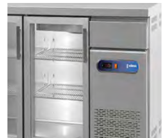
Con puerta de cristal.