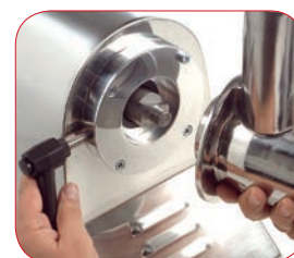
Modelo PI-32 con boca fácilmente desmontable para su limpieza.