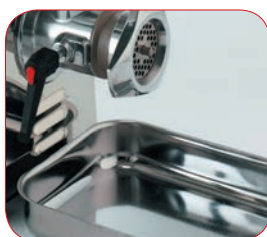
Bandeja de recogida en acero inox.