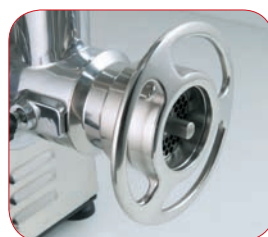
Detalle de la boca de la PI-22-U con sistema 1/2 Unger.