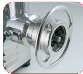
Detalle de la boca de la PI-22-U con sistema 1/2 Unger.