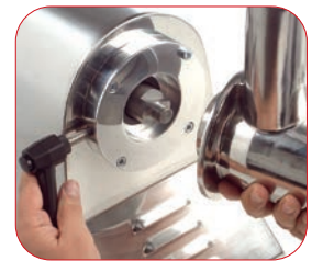
Modelo PI-32 con boca fácilmente desmontable para su limpieza.