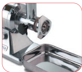
Con bandeja de recogida en acero inoxidable incorporada.