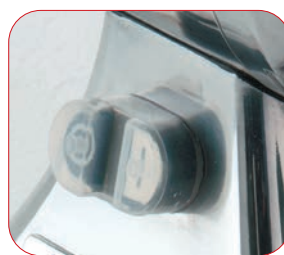
Interruptor marcha-paro con relé.