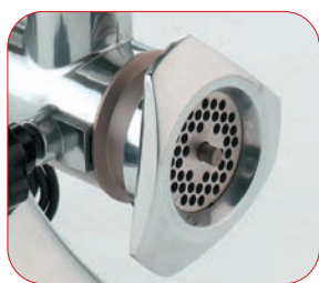
Detalle de la boca.