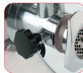
Completamente desmontable para una fácil limpieza.