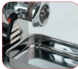
Bandeja de recogida en acero inox.