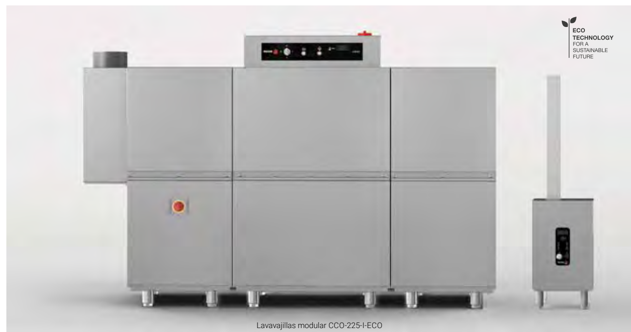
Lavavajillas modular CCO-225-I-ECO