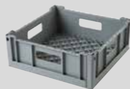
CESTILLO DE 350 x 350 mm