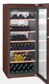
WKt 4552 GRAND CRU 201 BOTELLAS 75 cc