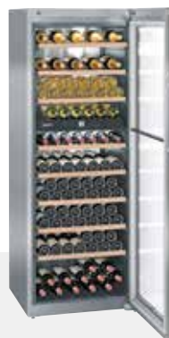
WTes 5972 VINIDOR INOX 211 BOTELLAS 75 cc