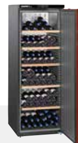
WKr 4211 VINOHEK 200 BOTELLAS 75 CC.