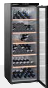
Wkb 4212 VINOHEK 200 BOTELLAS 75 CC.