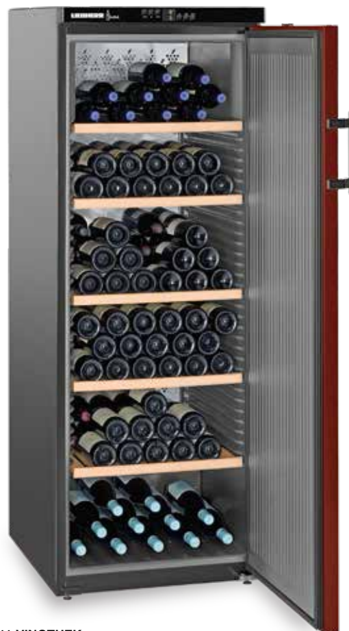
WTr 4211 VINOHEK 182 BOTELLAS 75 CC.

Se pueden regular las temperaturas en la parte inferior entre +5°C y +7°C, en la parte superior entre +16°C y +18°C, y en la parte central se van formando diferentes franjas de temperaturas.