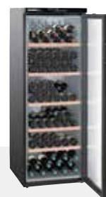
WTb 4212 VINOHEK 200 BOTELLAS 75 CC.