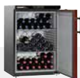
WKr 1811 VINOHEK 66 BOTELLAS 75 CC.