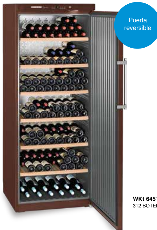
WKt 6451 GRAND CRU 312 BOTELLAS 75 cc