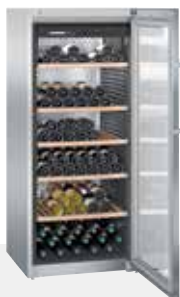
WKes 4552 GRAND CRU INOX 201 BOTELLAS 75 cc