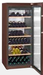
WKt 4552 GRAND CRU 201 BOTELLAS 75 cc