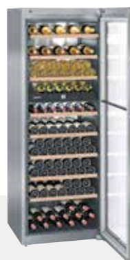
WTes 5972 VINIDOR INOX 211 BOTELLAS 75 cc