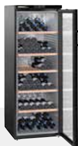
Wkb 4212 VINO THEK 200 BOTELLAS 75 CC.