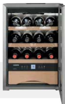
WKes 653 GRAND CRU INOX +5°C/+20°C

Sistema de atenuación de cierre SoftSystem.