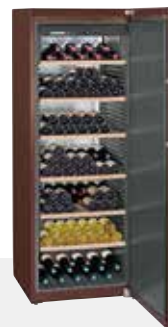
WKt 5551 GRAND CRU 253 BOTELLAS 75 cc