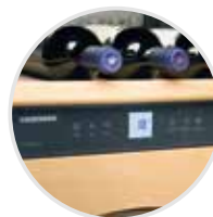
El moderno sistema electrónico