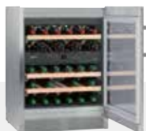
WTes 1672 VINIDOR LIBRE INSTALACIÓN 34 BOTELLAS 75 cc