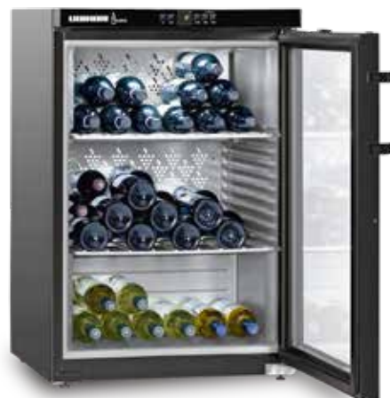
Wkb 1812 VINO THEK 66 BOTELLAS 75 CC..

Cristal de protección a rayos ultra violeta