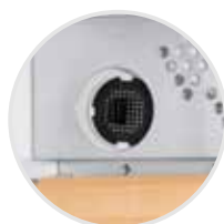
Filtro de carbón activo FreshAir

Terminación 2 Exterior en negro, puerta cristal