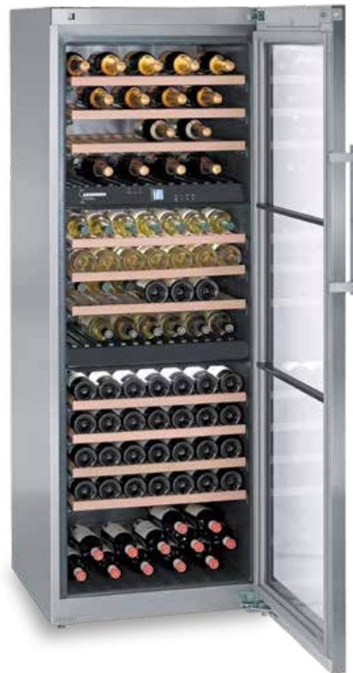
WTes 5872 VINIDOR INOX 178 BOTELLAS 75 cc