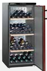
Wkr 3211 VINO THEK 164 BOTELLAS 75 CC.