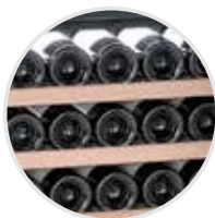
Estantes de madera, extraíbles.