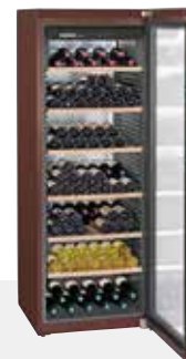
WKt 5552 GRAND CRU 253 BOTELLAS 75 cc