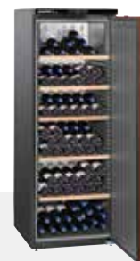
Wkr 4211 VINO THEK 200 BOTELLAS 75 CC.