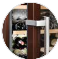
El sistema de atenuación de cierre SoftSystem