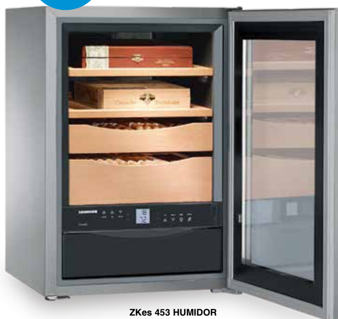
ZKes 453 HUMIDOR INOX +16°C/+20°C