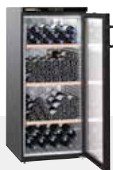
Wkb 3212 VINO THEK 164 BOTELLAS 75 CC.