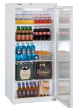
Fkv 5443 PUERTA DE CRISTAL