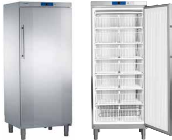
GKv 5760 - GKv 5790 GG 5260 - GGv 5060 CONJUNTO "SIDE BY SIDE" INOX