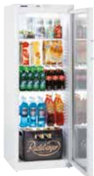
Fkv 3643 PUERTA DE CRISTAL