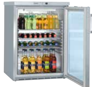
FKUv 1663 SEMI INDUSTRIAL EMPOTRABLE BAJO ENCIMERA