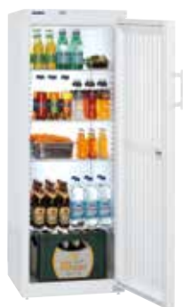
Fkv 3640 PUERTA CIEGA