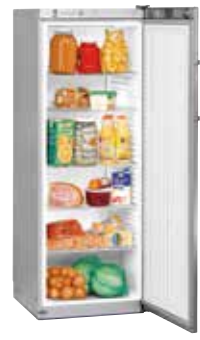
FKvsl 3610 SEMI INDUSTRIAL. VENTILADO