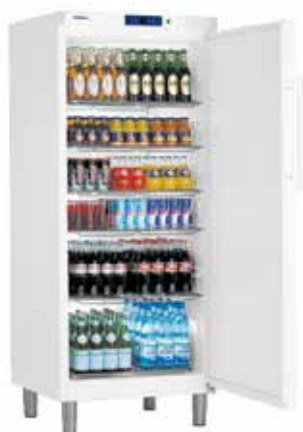
GKv 5710 INDUSTRIAL "GASTRO LINE" + 1°C / + 15°C