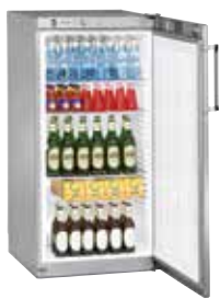
FKvsl 2610 SEMI INDUSTRIAL. VENTILADO