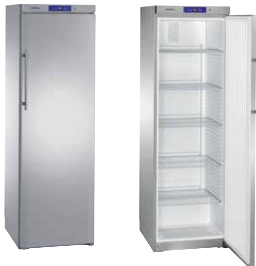
GKv 4360 - GG 4060 CONJUNTO "SIDE BY SIDE" INOX