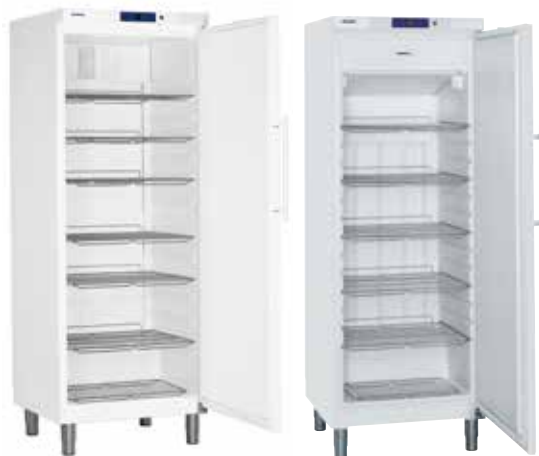
GKv 6410 - GGv 5810 CONJUNTO "SIDE BY SIDE" BLANCO