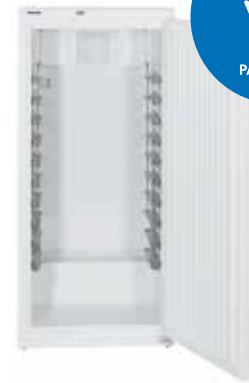
BKv 5040 PROFESIONAL PASTELERÍA