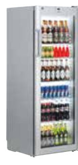
FKvsl 3613 SEMI INDUSTRIAL. PUERTA CRISTAL VENTILADO