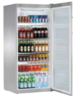
FKvsl 5413 SEMI INDUSTRIAL. PUERTA CRISTAL VENTILADO