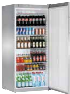
FKvsl 5410 SEMI INDUSTRIAL. VENTILADO