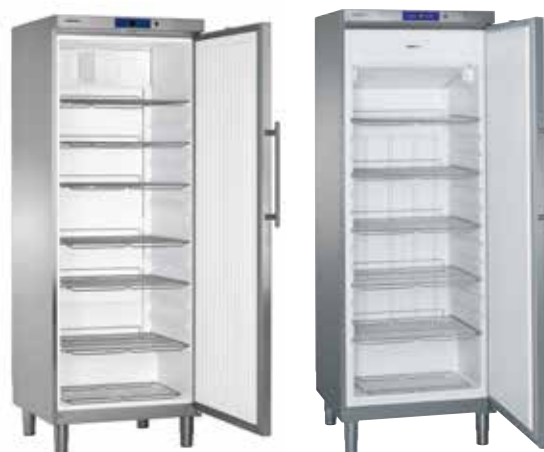
GKv 6460 - GGv 5860 CONJUNTO "SIDE BY SIDE" INOX