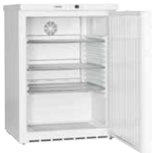
FKUv 1610 SEMI INDUSTRIAL EMPOTRABLE BAJO ENCIMERA