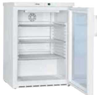
FKUv 1613 SEMI INDUSTRIAL EMPOTRABLE BAJO ENCIMERA