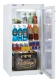
Fkv 2643 PUERTA DE CRISTAL