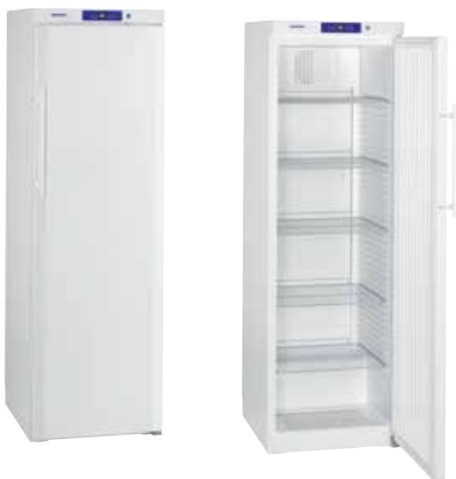
GKv 4310 - GG 4010 CONJUNTO "SIDE BY SIDE" BLANCO