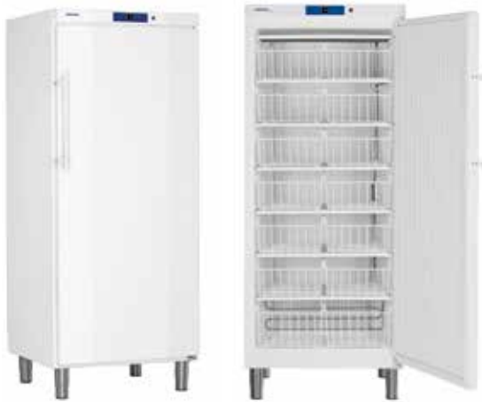
GKv 5710 - GKv 5730 GG 5210 - GGv 5010 CONJUNTO "SIDE BY SIDE" BLANCO