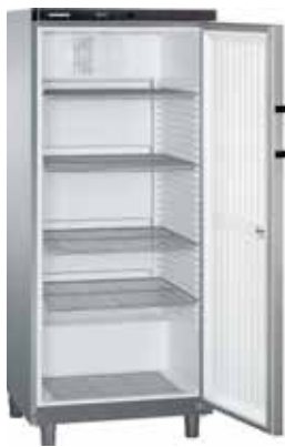
GKvesf 5445 INDUSTRIAL "GASTRO LINE"