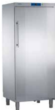
GKv 5760 INOX INDUSTRIAL "GASTRO LINE" + 1°C / + 15°C