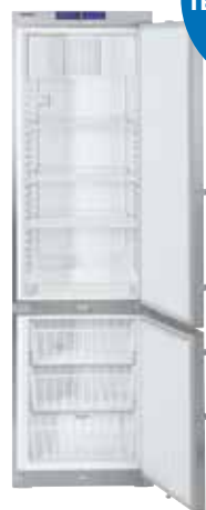
GCv 4060 COMBI industrial