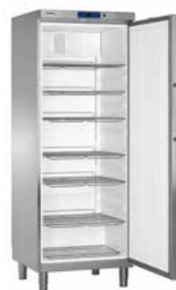
GKv 6460 INOX INDUSTRIAL "GASTRO LINE"