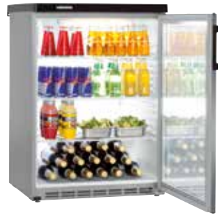
FKvesf 1803 EMPOTRABLE BAJO ENCIMERA PUERTA DE CRISTAL