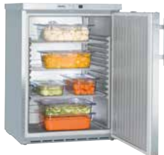
FKUv 1660 SEMI INDUSTRIAL EMPOTRABLE BAJO ENCIMERA