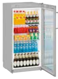
FKvsl 2613 SEMI INDUSTRIAL. PUERTA CRISTAL VENTILADO