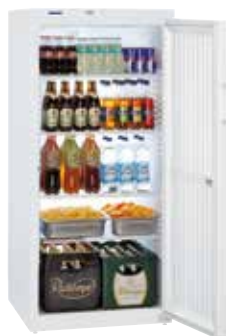
Fkv 5440 PUERTA CIEGA