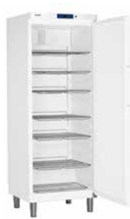
GKv 6410 INDUSTRIAL "GASTRO LINE"