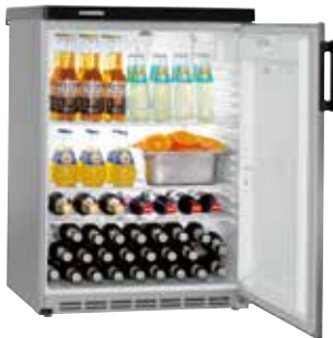
FKvesf 1805 EMPOTRABLE BAJO ENCIMERA PUERTA INOX