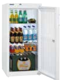
Fkv 2640 PUERTA CIEGA