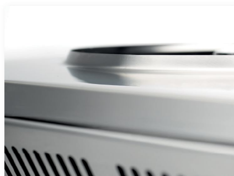
Embutición protectora del interior Inlay to protect inside

► Medidas comunes: 50 cm de profundidad x 24 cm de altura. ► Diámetro útil de la placa: 350mm. ► Calor uniforme en toda la superficie de la placa. ► Placa de acero rectificando de 15mm de espesor. ⬆ Quemador de estrella de gran rendimiento. ► Válvulas de gas con termopar de seguridad. ⚡ Resistencia blindada en acero inoxidable. ► Control de la temperatura a través del termostato.