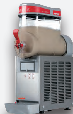
Mod. MT MINI 1