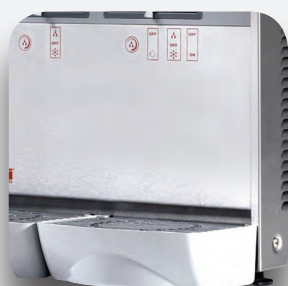
Recoge gotas extraíble.