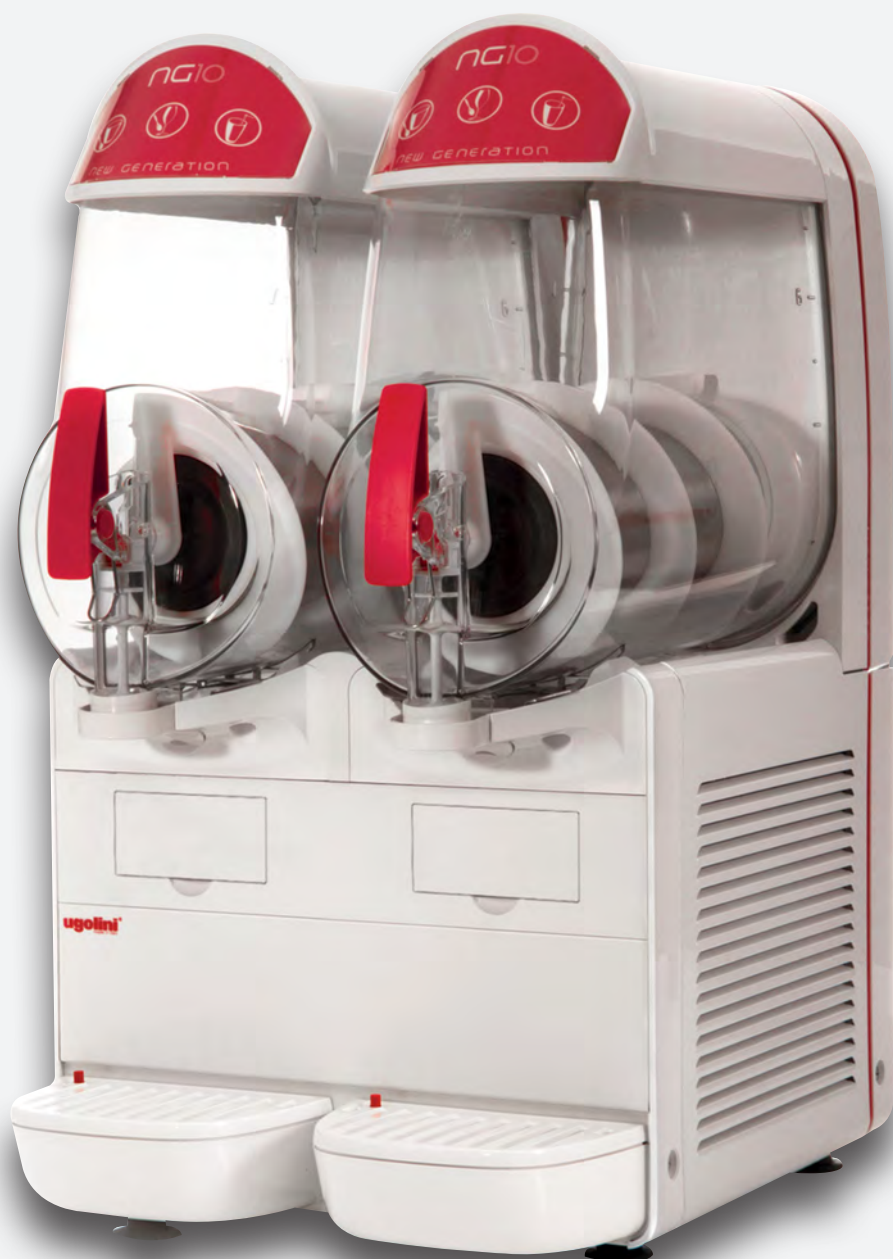
Mod. NG 10/2 EASY