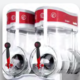
Depósitos de 15 litros.