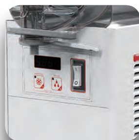
Control electrónico MICRO.