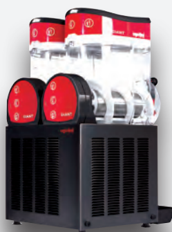
Mod. GIANT NEGRA