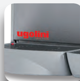
Recoge gotas extraíble.