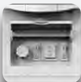
Panel mandos electromecánicos.