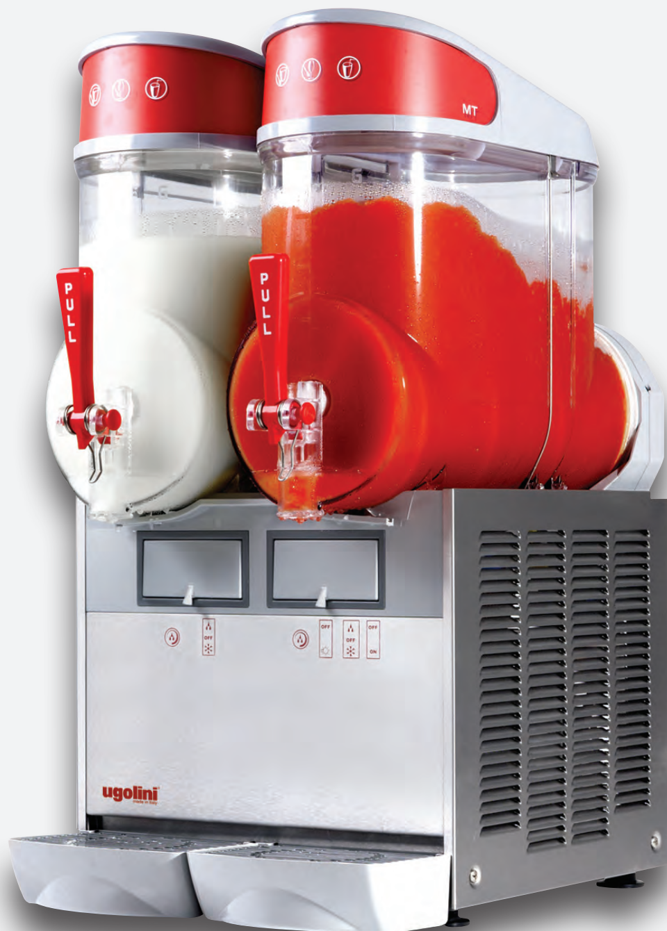
Mod. MT 2B