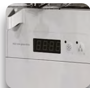
Control electrónico ICON.