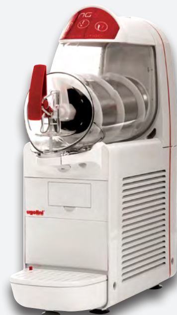
Mod. NG 6/1 EASY