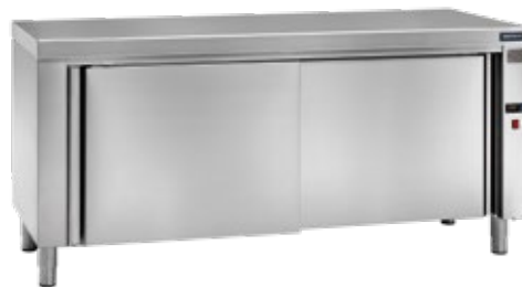
MEDIDAS MESA CALIENTE