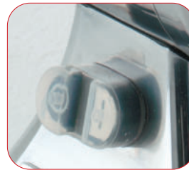
Interruptor marcha-paro con relé.