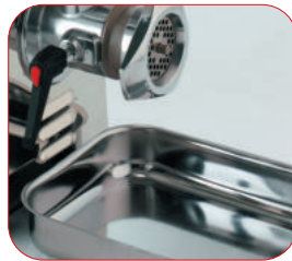
Bandeja de recogida en acero inox.