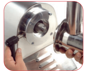
Modelo PI-32 con boca fácilmente desmontable para su limpieza.