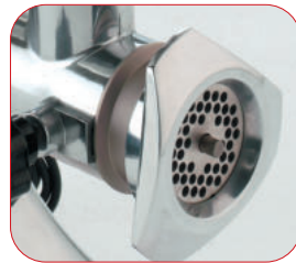
Detalle de la boca.