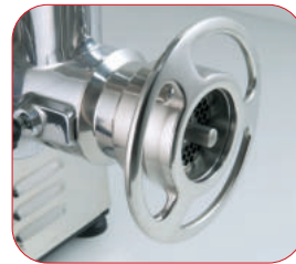
Detalle de la boca de la PI-22-U con sistema 1/2 Unger.