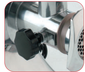
Completamente desmontable para una fácil limpieza.