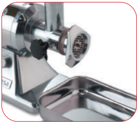
Con bandeja de recogida en acero inoxidable incorporada.