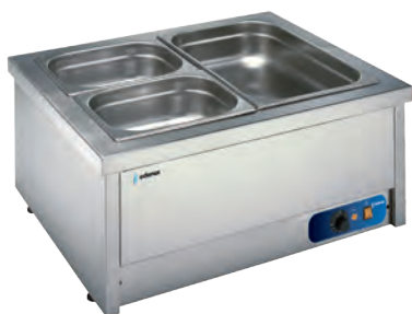
BMSM-211-S Baño María sobremesa sin agua.