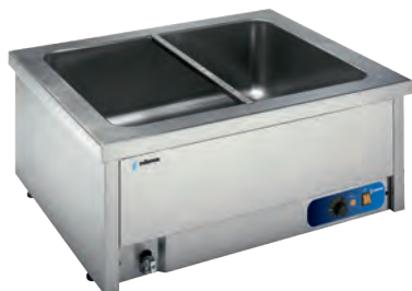
BMSM-211 Baño María sobremesa con agua.