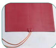
Calefacción de la cuba con resistencias de silicona (Modelos BMSM).