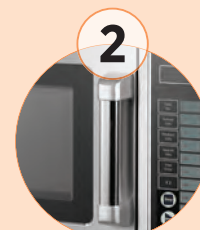
2 Asa ergonómica, que realiza el diseño del microondas