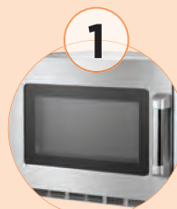
1 Cristal externo para poder visualizar el producto