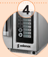
4 Filtro de aire desmontable. (modelo 1834)