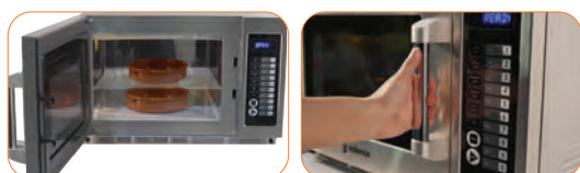
Gran capacidad de cocinado, gracias a sus dos niveles Todos los componentes de la cámara en acero inoxidable.