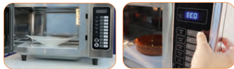
Base cerámica plana Panel de control "Touch" con led display, tres niveles de potencia.