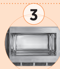
3 Cámara en acero inoxidable