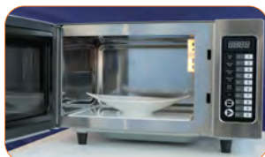
Base cerámica plana