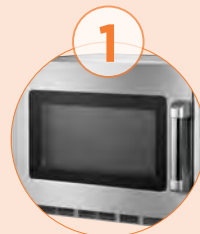
Cristal externo para poder visualizar el producto