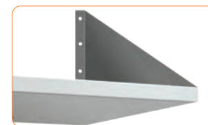
Cartabones laterales de sujeción en la misma chapa