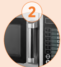
Asa ergonómica, que realiza el diseño del microondas