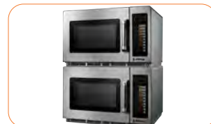
El modelo de 34 litros permite remontar los microondas.