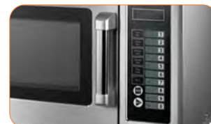
Panel de control "Touch" con led display, tres niveles de potencia.