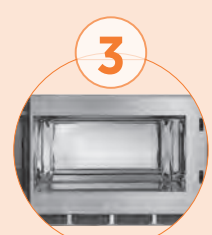
Cámara en acero inoxidable