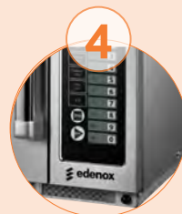
Filtro de aire desmontable. (modelo 1834)