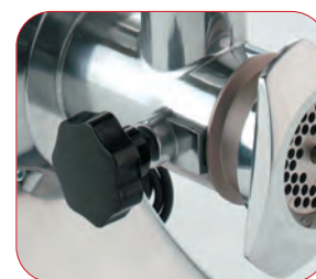
Completamente desmontable para una fácil limpieza.