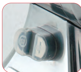
Interruptor marcha-paro con relé.