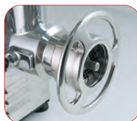
Detalle de la boca de la PI-22-U con sistema 1/2 Unger.