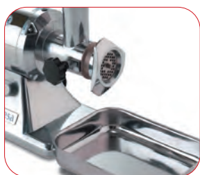
Con bandeja de recogida en acero inoxidable incorporada.