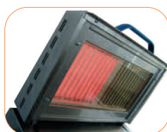
Calentamiento inmediato con zonas de cocción independientes.