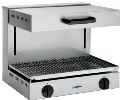
SE-E-60-M Salamandra de gran capacidad con alta potencia de cocción