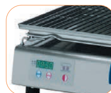
Panel de mandos con visualización digital.